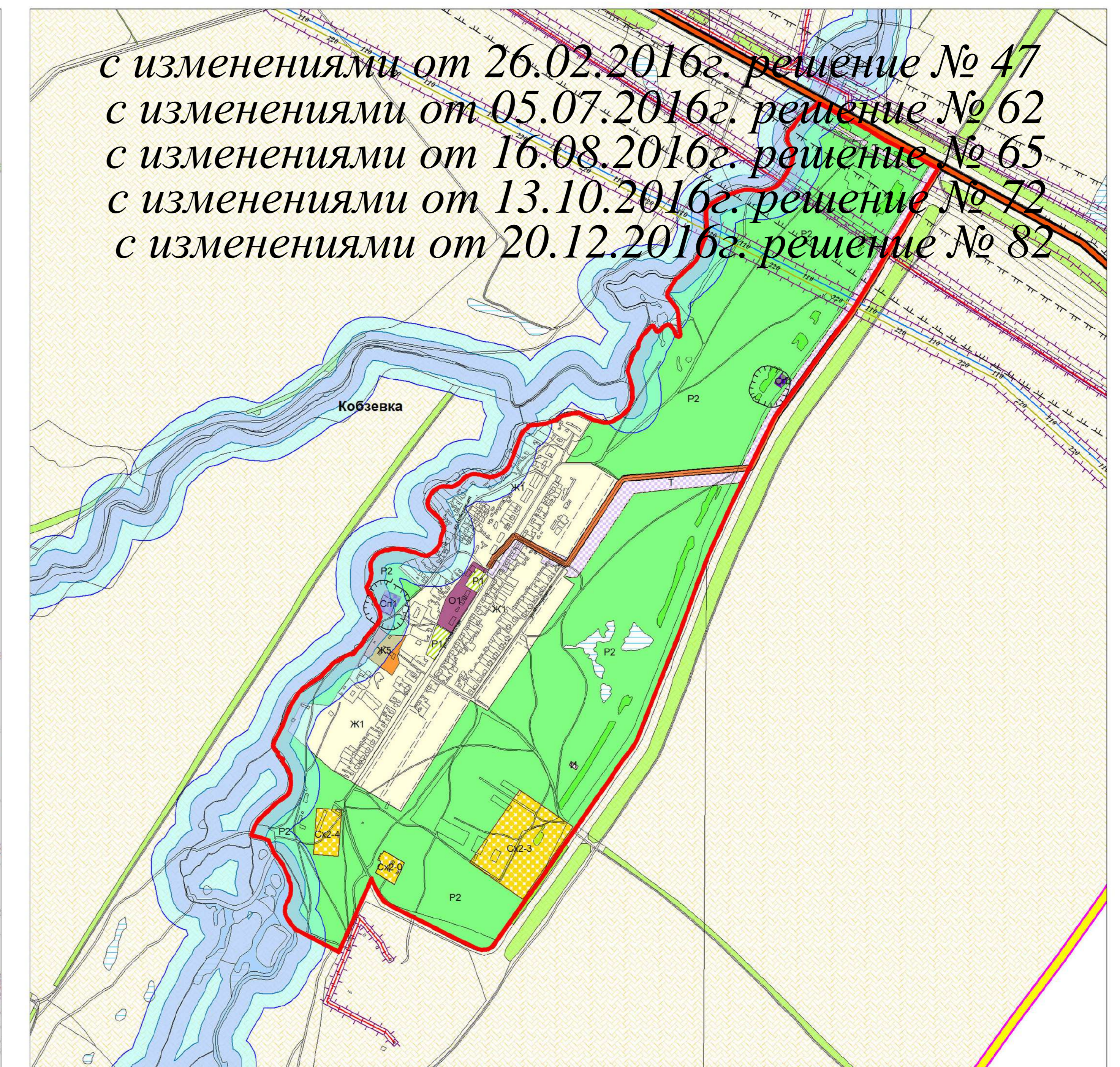
Карта градостроительного зонирования п. Морец муниципального района Большеглушицкий Самарской области