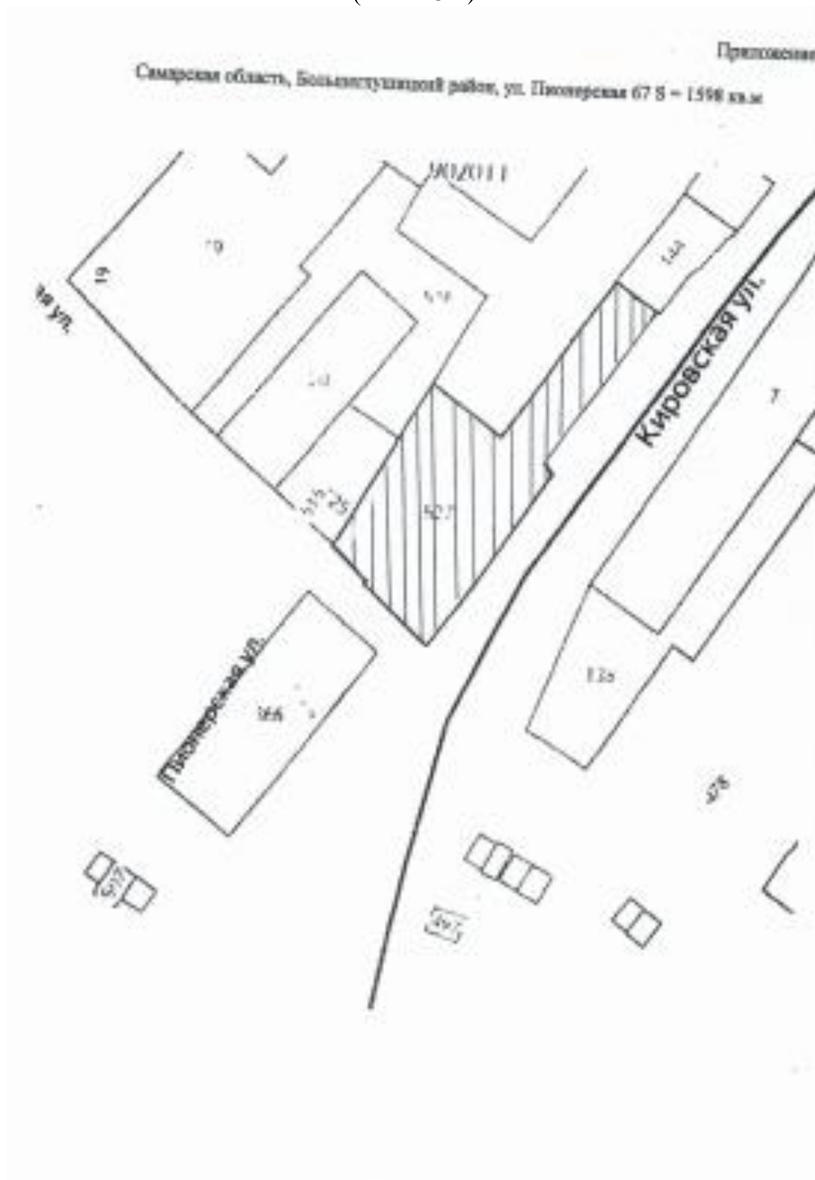
Схема расположения земельного участка на кадастровом плане территории ( Ж1 – О1 )